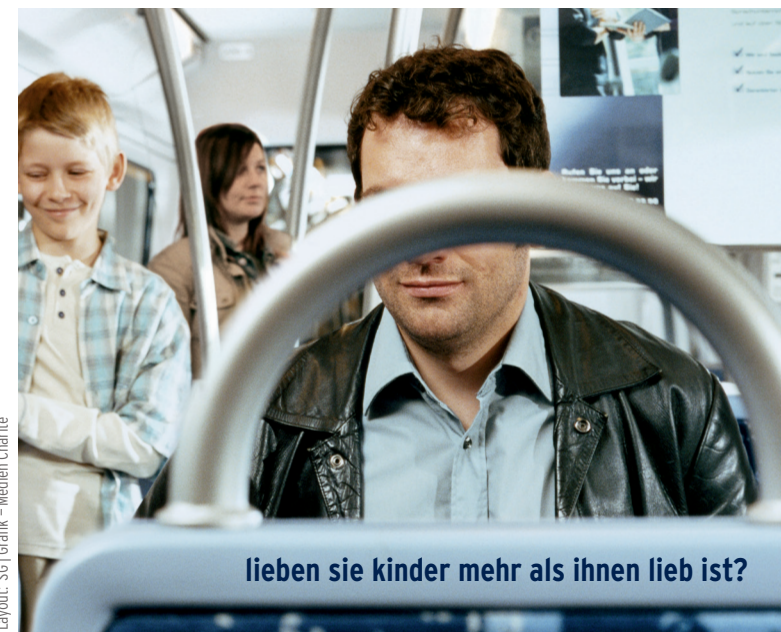
Layout: SGI Grafik - Medien Charité

Es gibt Hilfe – kostenlos und unter Schweigepflicht!